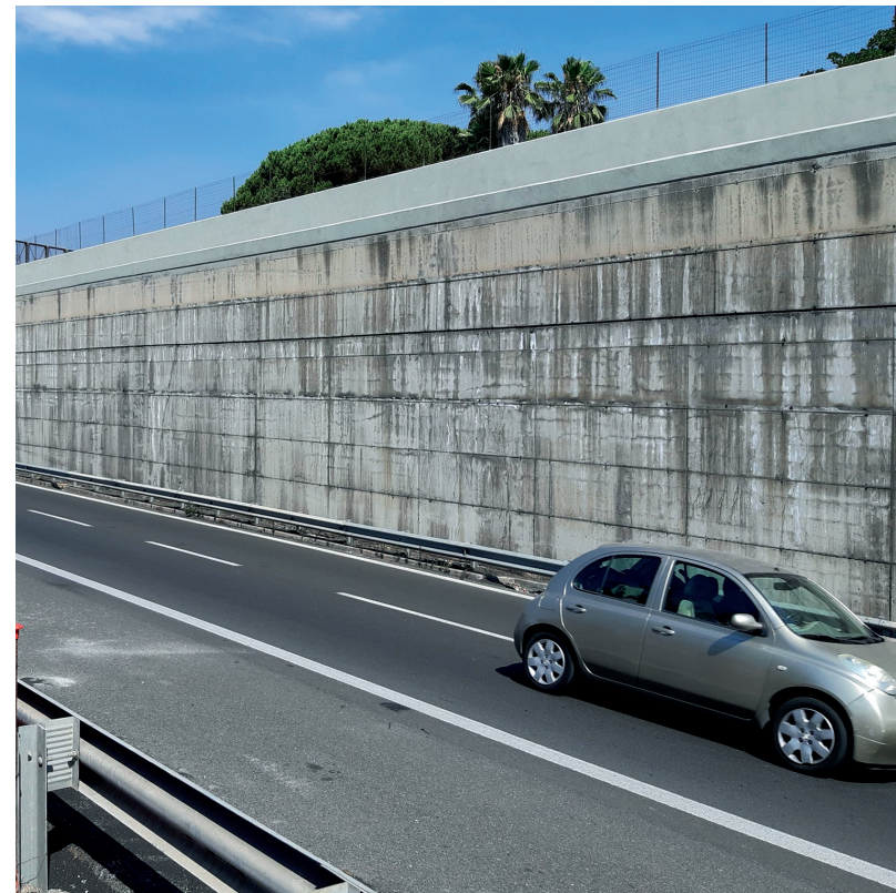
Parete in calcestruzzo prima dell'intervento di mitigazione acustica.