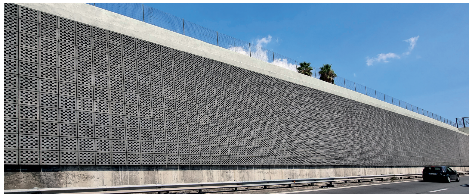
Intervento di mitigazione acustica con Lecablocco Fonoassorbente FonoLeca Quadro.